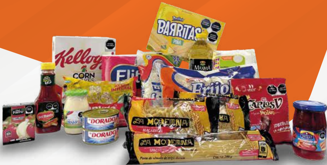
Imagen con fines ilustrativos | Los artículos pueden variar

Solo tienes que solicitar un crédito ordinario, socio cumplido o credicomero a partir de $10,000.00 pesos o crédito automático a partir de $20,000.00 pesos y ahorrar cada mes la cantidad mínima de $200.00 pesos a partir del crédito solicitado.